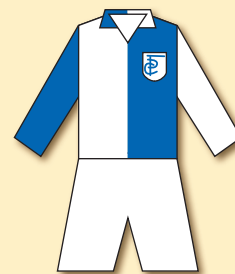
DFC Prag (1898)