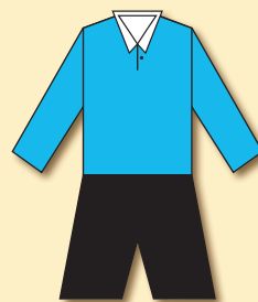
DSV Troppau (1911)