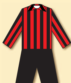
ČAFC Královské Vinohrady (1900)