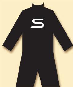
AC Sparta Praha (1896)