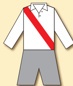
AC Praha (1897)