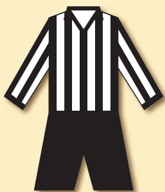
SK Smíchov (1909)