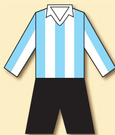
AFK Kolín (1911)