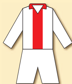
SK Meteor Libeň (1899)