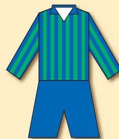
Karlsbader FK (1912)