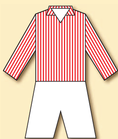
SK Viktoria Žižkov (1903)