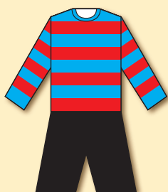
Loučenská zámecká XI (1893)