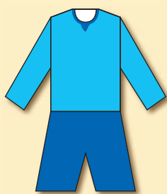
Staroměstský SK Olympia (1910)