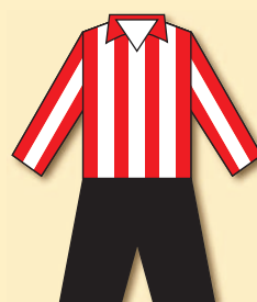
AC Sparta Praha (1904)